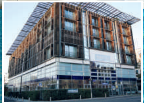
LES THERMES jean nouvel